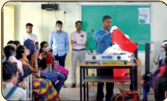
गृहविज्ञान विभाग आयोजित उद्योजकता ट्रेनिंग प्रोग्राम

Certificate Course in ● GST ● Bakery Products ● Beautification ● Writing Skills