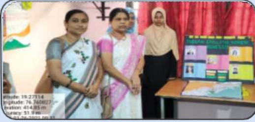
प्रजासत्ताक दिनानिमित्त इंग्रजी विभागाचे भित्तीपत्रक विमोचन