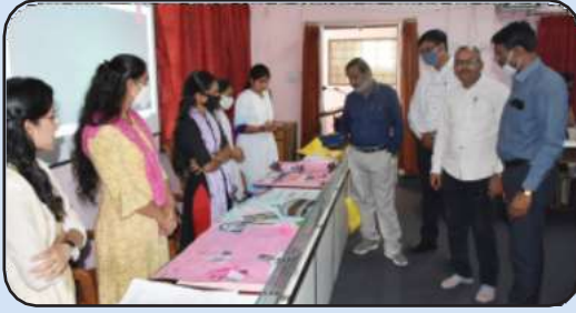
राज्यशास्त्र विभाग आयोजित भित्तीपत्रक स्पर्धा