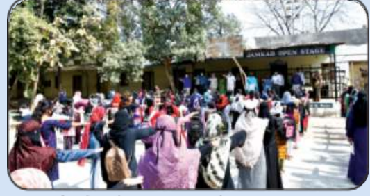
राष्ट्रीय सेवा योजना विभाग आयोजित संविधान दिन