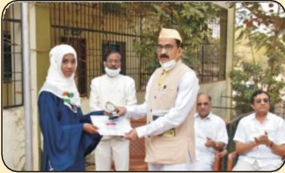
राज्यशास्त्र विभाग आयोजित भितीपत्रक स्पर्धेचे पारितोषिक वितरण सोहळा