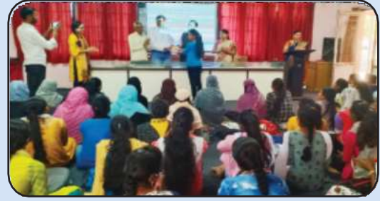
मराठी भाषा संवर्धन पंधरवडा निमित्त बक्षीस वितरण कार्यक्रम