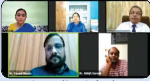
IQAC विभागाच्यावतीने सात दिवसीय राष्ट्रीय स्तरावर ऑनलाइन FDP चे आयोजन करण्यात आले