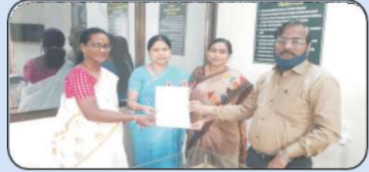
अकॅडमिक आणि एडमिनिस्ट्रेटिव्ह ऑडिटमध्ये ओ ग्रेड प्राप्त