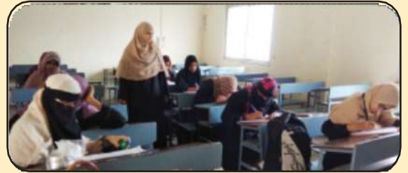
उर्दू विभाग आयोजित निबंध स्पर्धा