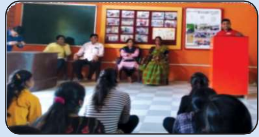
समाजशास्त्र विभाग आयोजित, केरवाडी येथील स्वप्नभूमी अनाथ आश्रमारा सभेत