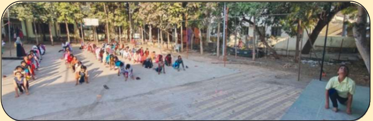
क्रीडा विभागाकडून सूर्यनमस्कार शिबीराचे आयोजन