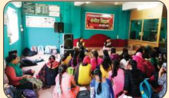
संगीत विभाग आयोजित गीत गायन स्पर्धा