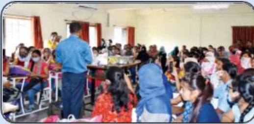
वाणिज्य विभागामार्फत तीन दिवसीय उद्योजकता विकास कार्यशाळेचे आयोजन